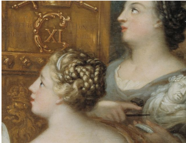
Figura 4: Dettaglio di figura 2.

Qui Edvige Eleonora si mette in scena nel suo ruolo come regina madre, come reggente, come patrona delle arti o quale committente di edifici nel senso più ampio del termine, ma non come vedova. In primo piano le allegorie della Magnificentia con un richiamo alle arti dell' Architectura , Pictura e Sculptura presentano diversi progetti di costruzione per gli edifici a cui si era dedicata Edvige Eleonora. Al centro c'è Drottningholm, il palazzo per cui era stato realizzato il presente dipinto e in cui è esposto ancora oggi. Oltre ad esso si rimanda anche a Strömsholm, Gripsholm, Vadstena e Ulriksdal come altri progetti edili. Al margine destro del dipinto, a sinistra della regina, davanti al trono, la Scultura tiene in mano l'unico rimando a Carlo X Gustavo. Indica un «modellino del ritratto del beato sovrano defunto» 61 ed è pronta a realizzare un busto in memoria.