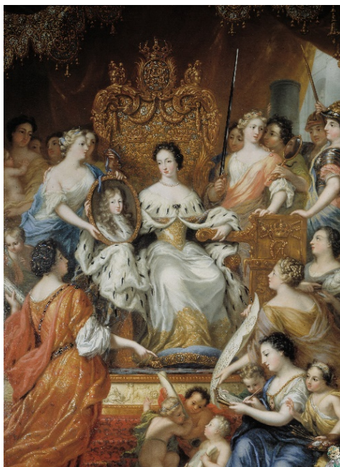
Figura 2: David Klöcker Ehrenstrahl, Allegori över änkedrottning Hedvig Eleonoras förmyndarregering (allegoria sul regno della regina vedova Edvige Eleonora come tutrice), 1692, Olio su tela, 353 x 222 cm. Stockholm, Nationalmuseum, Drottningholmsamlingen, NMDrh 125, pubblico dominio, URL: https://collection.nationalmuseum.se:443/eMP/eMuseumPlus?service=ExternalInterface&module=collection&objectId=174867&viewType=detailView (25.06.2025) 56.

In questo dipinto del 1692 Edvige Eleonora è raffigurata all'età di 24 anni, ossia poco dopo la morte di Carlo X Gustavo, mentre «si occupò non solo dell'alta cura dell'educazione buona e lodevole del Suo signor Figlio/ il Re CARLO XI, ma guidò anche il governo del regno a fianco dei tutori reali, oltre ad erigere diversi edifici» 57 . Il dipinto, realizzato più di trent'anni dopo l'epoca raffigurata, deve quindi anche fornire un'impressione del ruolo di Edvige Eleonora come reggente, mostrandola come responsabile dell'educazione del