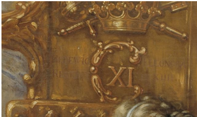
Figura 3: Dettaglio di figura 2.

figlio. La giovane Edvige Eleonora è seduta al centro del dipinto in «in manto rosso porpora, foderato di pellicce di ermellino» 58 su un trono sopraelevato, circondata da numerose figure femminili, allegorie e figure di bambini. Alla sua destra Fides (la fede) insieme a Edvige Eleonora sorregge un ritratto del giovane Carlo XI all'età di cinque anni, quindi sempre, all'incirca, nel 1660. Sempre alla destra della regina stanno Charitas (carità), Spes (speranza), Clementia (clemenza) e Candor (sincerità), che servono come rappresentazioni del ruolo di Edvige Eleonora come regina madre. Mentre Edvige Eleonora ha lo sguardo rivolto verso destra al ritratto del figlio, la sua mano sinistra è poggiata sulla barra della pala di un timone con le insegne CXI (Carolus XI). A sinistra è sorretta da Justitia (giustizia), Magnanimitas (grandezza d'animo), Fortitudo (fortezza), Prudentia (prudenza) e Temperantia (temperanza). Queste cinque virtù devono raffigurare al contempo anche gli altri membri del consiglio di reggenza. Le virtù, quindi, poggiano anche loro una mano sulla pala del timone, ma la barra «resta soltanto nelle mani di Sua maestà» 59 . Di conseguenza sulla pala del timone, sotto il segno di Carlo XI si trova anche il nome di Edvige Eleonora e l'indicazione che «condusse il governo per 14 anni» 60 .