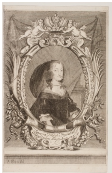
Figura 2: I tre tipi di stampe raffiguranti l'imperatrice vedova Eleonora Gonzaga-Nevers