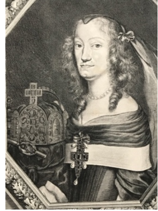
Figura 3: Dettagli

A sinistra: Dettaglio di un ritratto in busto dell'imperatrice vedova Eleonora Gonzaga-Nevers con la corona del Sacro Romano Impero, Metà del XVII secolo, Olio su tela, 130 x 91,6 cm. Bratislava, Slowakische Nationalgalerie, Inv. Nr. O 98.