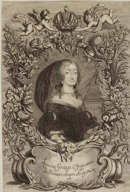
Figura 4: HERRSCHAFTEN KRIEGS= UND STAATS=BEDIENTEN, Vol. 1, a cura della Fürstlich Waldecksche Hofbibliothek in Arolsen, s.a., p. 53.